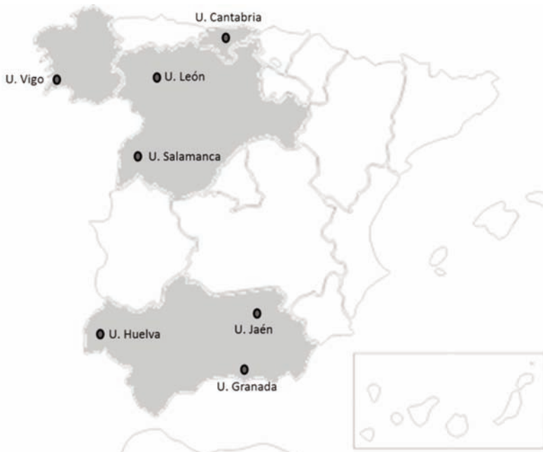
Figura 2 Distribución geográfica de las Universidades participantes en el Proyecto uniHcos

La recogida de información comenzó en diciembre de 2011, habiendo participado hasta ese momento un total de 1.363 individuos. Las encuestas se realizaron mediante cuestionario ad hoc online autocontestado, a través de la plataforma SphinxOnline®, que permite la creación de dos archivos