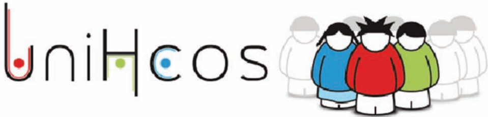
Figura 1 Logotipo del proyecto uniHcos

La invitación para participar en el estudio se envió a todos los alumnos que cumplieron los criterios de inclusión a los correos electrónicos institucionales, incluyendo una carta explicativa del estudio y sus objetivos, así como un consentimiento informado que debía ser cumplimentado por cada estudiantes para participar en el estudio, aclarando a su vez que los datos cedidos serán tratados de modo confidencial según dicta la Ley