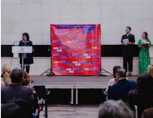
Las Palmas de Gran Canaria

https://siprep.isciii.es/blog/-/blogs/prep-party-visita-las-palmas-y-torremolinos