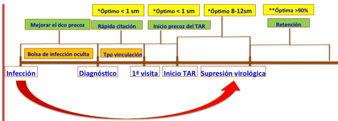
Figura 1. Diferentes puntos desde el momento de la infección hasta la vinculación y supresión virológica

*Los tiempos son estimativos y se pueden alargar por múltiples circunstancias relacionadas con la gestión de la consulta y/o del paciente