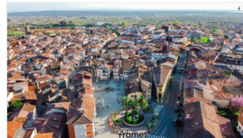
Over Frames 14 de marzo de 2020 · 🌐 Vista aérea de Candeleda a día 14 de Marzo de 2020. Así lucen las calles un sábado soleado en plena cuarentena por la crisis del COVID-19.